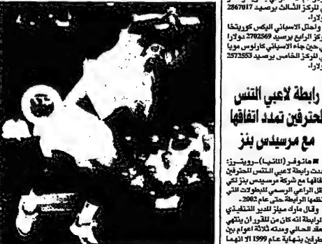
سامبراس